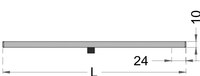
D-TS – ΠΛΑΓΙΑ ΟΨΗ